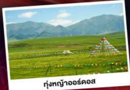
ทุ่งหญ้าออร์ดอส