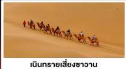
เนินทรายเสี่ยงชาวน