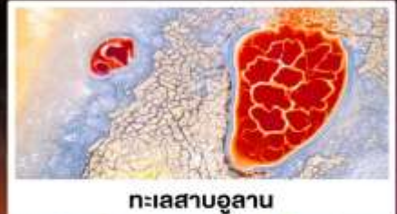
ทะเลสาบอูแลกัน

🏠 พักโรงแรมพื้นเมือง แบบกันสนิม มีห้องน้ำในตัว