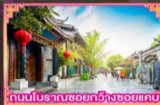
ถนนโบราณซอยกว้างซอยแคบ