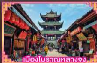
เมืองโบราณหลวงจง