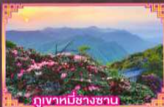
ภูเขาที่มีชาวชน