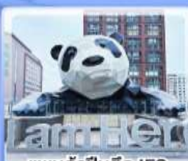
แพนด้าปิ่นตึก IFS