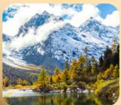
“ปี่เิงโกว”

ชมธรรมชาติ 2 อุทยานขึ้นชื่อ อุทยานภูเขาสี่ดรุณี + อุทยานปี่เิงโกว สะพานหนานเฉียว • ถนนคนเดินไ่กู่หลี่ + ซุนซีลู่ + Pop Mart • ดงเจียวจื่อ