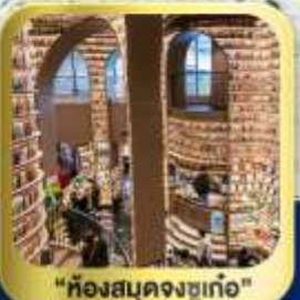
"ห้องสมุดจงซูเก๋อ"