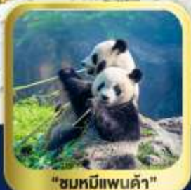
"ชมหมีแพนด้า"