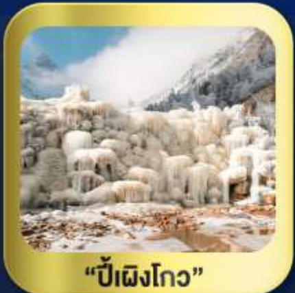
"ปี้เฉิงโกว"

นั่งกระเช้าชมวิว ภูเขาหิมะ-ต้ากู่กลาเซียร์ • ชมความสวยงาม ณ อุทยานปี้เฉิงโกว ห้องสมุดจงซูเก๋อ • ศูนย์หมีแพนด้า • ตงเจียวจี้ • ซอยกว้างชวยແคน