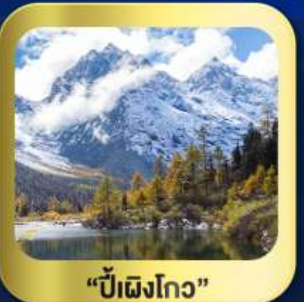
"ปี้เฉิงโกว"