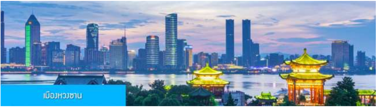
เมืองหวงซาน