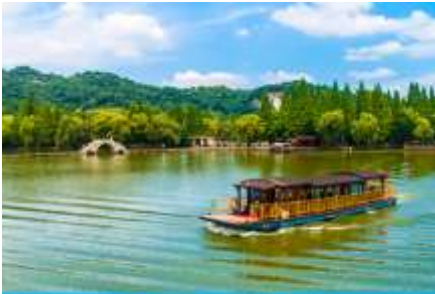
ล่องเรือทะเลสาบเจียนหู