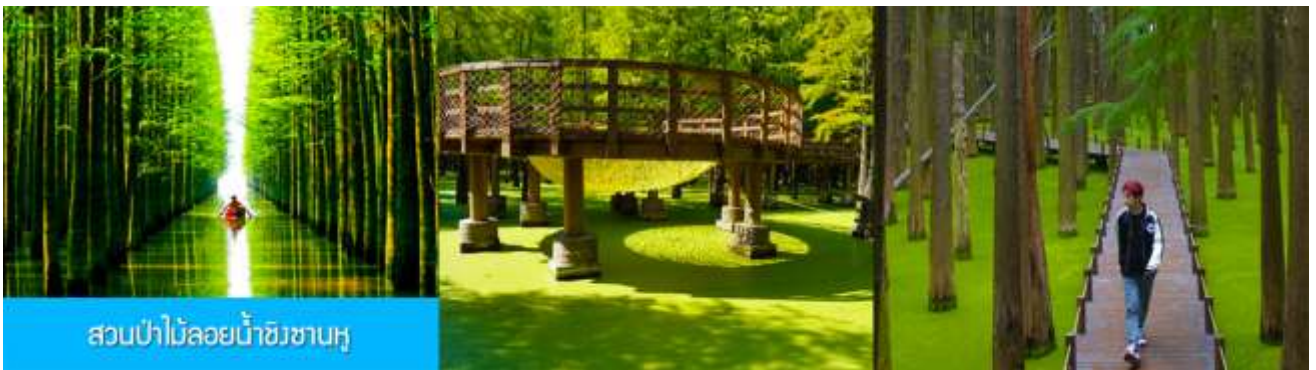
สวนป่าไผ่ลอยน้ำชิงซานหู