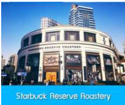
Starbuck Reserve Roastery

พักที่ โรงแรม Tongpai Hotel Or Holiday inn express Hotel 4* หรือเทียบเท่าในเมืองเซี่ยงไฮ้