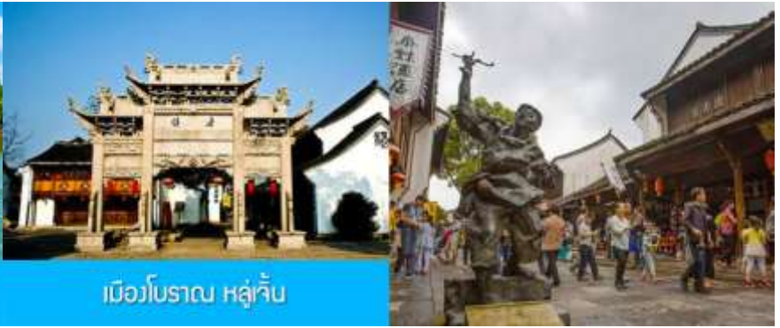
เมืองโบราณ หลู่จิ้น

นำท่าน ล่องเรือในทะเลสาบเจียนหู ผ่านชมทัศนียภาพที่งดงามราวภาพเขียนของสองฝั่ง ที่มีทั้งสะพานโค้ง โบราณ ศาลาเก๋งจีน และบ้านเรือนโบราณ.....นำท่านเที่ยวชม เมืองโบราณหลู่จิ้น 鲁镇 เมืองโบราณที่โด่งดังจากนักประพันธ์ที่มีนามว่า หลู่ชวี่น 鲁迅 ที่นี่เป็นเมืองโบราณริมน้ำสไตล์เจียงหนานของจีน..... จากนั้นนำท่านเดินทางสู่ เมืองหังโจว (ระยะทาง 50 กม. ใช้เวลาเดินทางราว 1 ชั่วโมง)