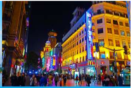
ถนนคนเดินหนานจิงลุ่

หลังอาหารนำท่านเดินทางสู่ นครเซี่ยงไฮ้ 上海 (ระยะทาง 210 กม. ใช้เวลาเดินทางราว 3 ชั่วโมง)