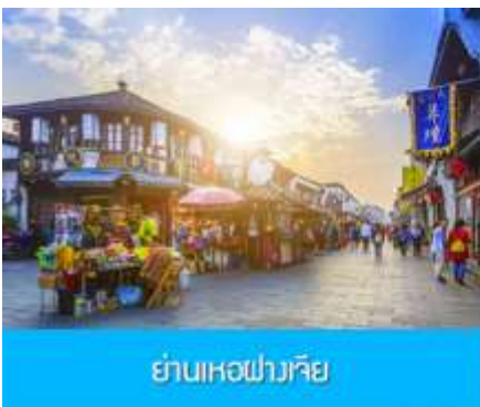
ย่านเหอฝางเจีย

อิสระอาหารมื้อกลางวัน ท่านสามารถเลือกชิม STREET FOOD ขึ้นชื่อมากมายในย่านเหอฝางเจีย