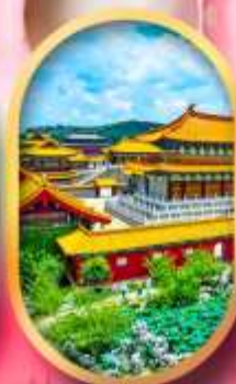
เมืองจำลองสามก๊ก