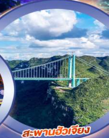
สะพานฮัวเจียง