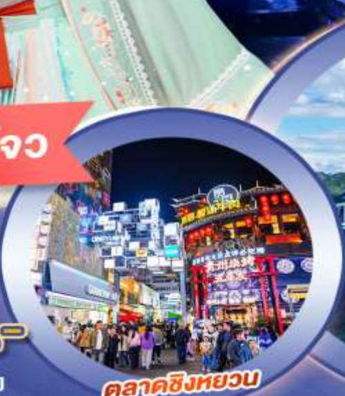
ตลาดซิงหยวน