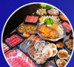
พิเศษ!! ขาหมูสีโตล้จันสุดเลิศรส