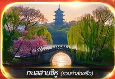
ทะเลสาบซีหู (รวมค่าล่องเรือ)