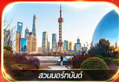
สวนนอร์มันด์