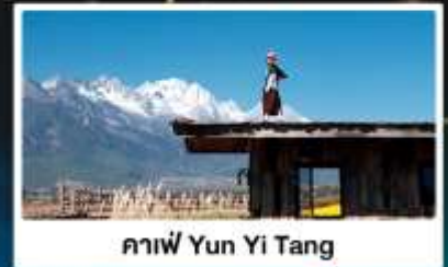
คาเฟ่ Yun Yi Tang