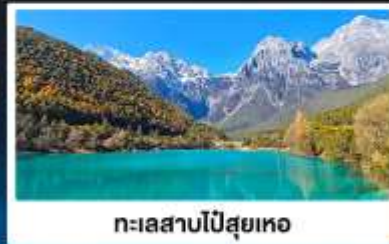
ทะเลสาบโป๋สยู่เหอ