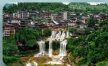
หมู่บ้านฟุหลงเจิ้น