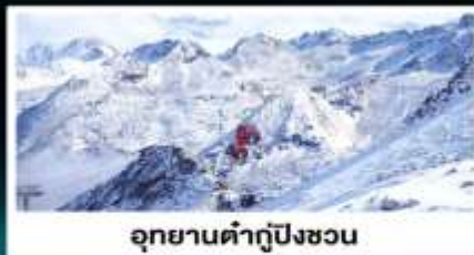
อุทยานต้ากู่ปิงซอน