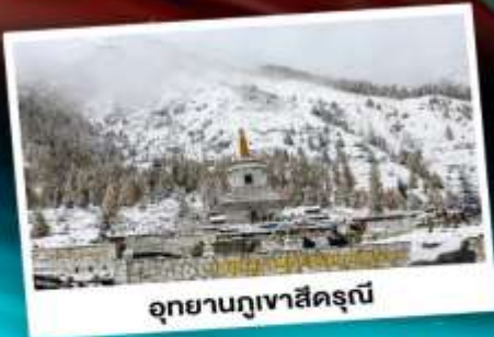
อุทยานกุเวาสีตฺรุณี