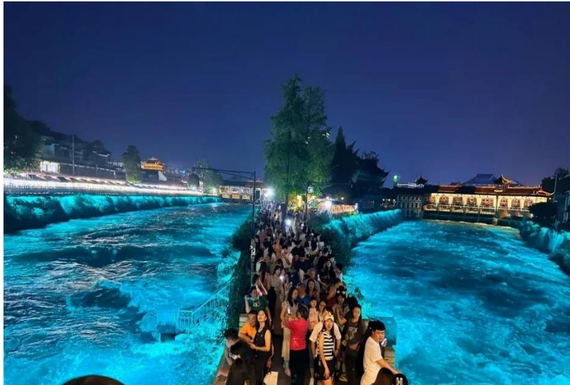
อย่างลึกลับราวกับโลกแห่งเทพนิยาย