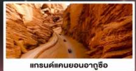
แกรนด์แคนยอนอาถูซือ