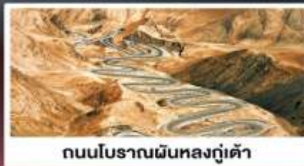
ถนนโบราณผืนหลงกู่เต้า