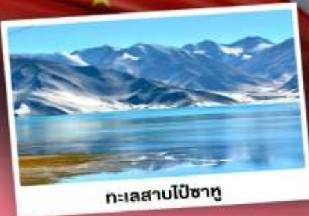
ทะเลสาบไปซาทุ

เปิดประตูสู่อารยธรรมพันปีแห่งซินเจียงใต้ ชมความสวยงามของหมู่บ้านดอกแอปเปิ้ล