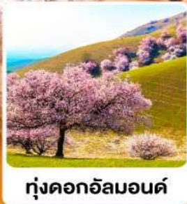
ทุ่งดอกอัลมอนต์