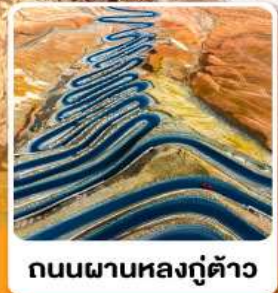
ถนนผานหลงตู้ต้าว