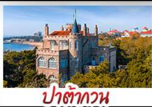
ป่าตึกวน

พระราชวังฤดูร้อน - วิวเมืองสิงเต่า รถไฟความเร็วสูง - ภูเขาเหลาซาน กำแพงเมืองจีนด้านจวียงกวน - ป่าตึกวน พักโรงแรมระดับ 4 ดาว - ไม่ลงร้านช้อปปิ้ง มือพิเศษ เปิดปักกิ่ง , หม้อไฟซีฟู้ด