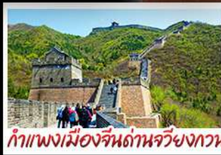
กำแพงเมืองจีนด้านจวียงกวน