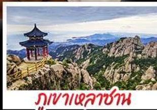
ภูเขาเหลาซาน