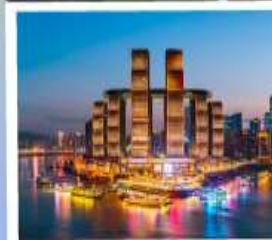
ตึกรูปเฟีย