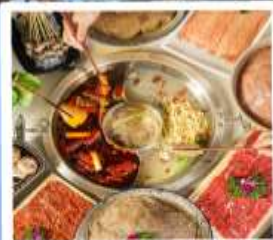
หม้อไฟหมาล่า