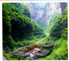
หลุมฟ้าสะพานสวรรค์